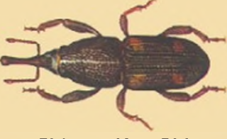
Pirinç ve Mısır Biti