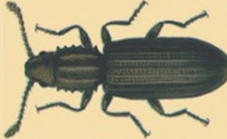
Hububat ve Bakliyat Zararlısı