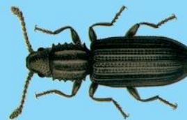
Hububat ve Bakliyat Zararlısı