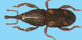
Pirinç ve Mısır Biti